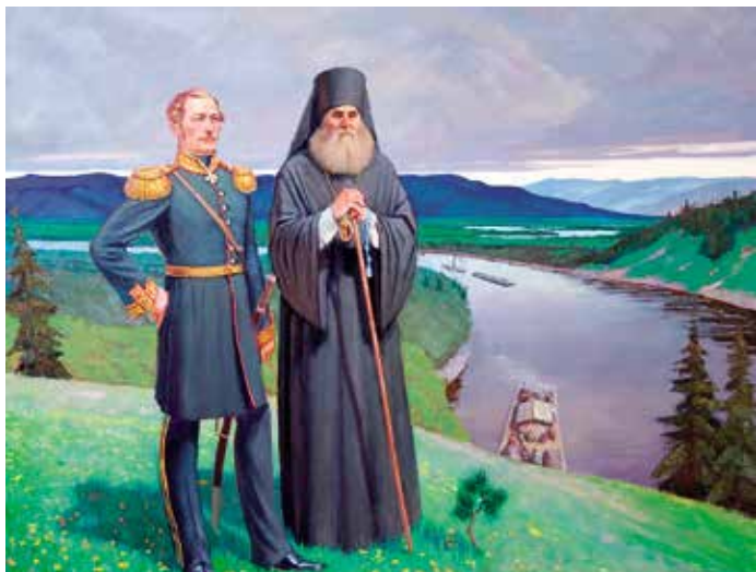
святитель Иннокентий Московский и граф Муравьев-Амурский