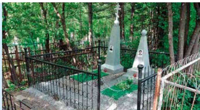
Могила протоиерея Константина Семеновича Карнаухова и его супруги на городском кладбище г. Уссурийска