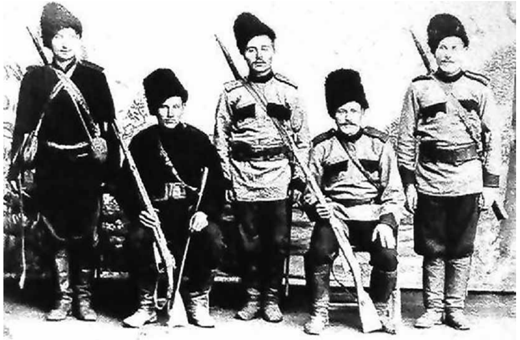
Уссурийские казаки. 1870 год.

А иногда и сами камни рассказывают истории. Вот и остатки фундамента могут поведать о былом. Итак, стены церкви были выложены в виде креста, в память о Кресте Господнем. Вход в нее, по канонам, находился с западной стороны. Судя по фундаменту видно, что внутри здание делилось на три части. Начиная с западной стороны - притвора, где во время служб стояли кающиеся или оглашенные, то есть прихожане, желающие креститься, но еще не прошедшие Таинства