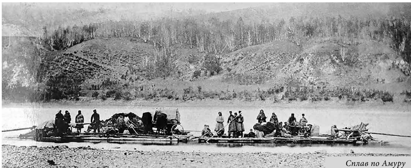
Сплав по Амуру

Нижней улице и на сельском кладбище, церкви в честь святого Георгия Победоносца и Казанской иконы Божией Матери. В 1915–1916 годах была выстроена новая Усть-Уссурийская Казанская церковь (сгорела в 1921 году).