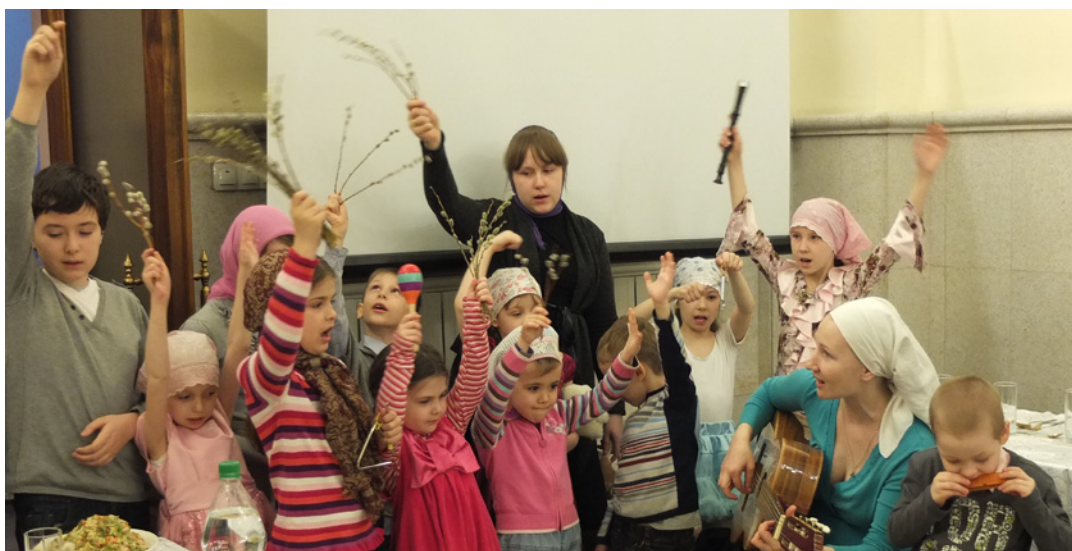
Готовимся к празднику

ответ. Самое главное время – сейчас. Самый главный человек – тот, что со мной рядом. Самое главное дело – то, которое я для этого человека делаю. Эта мудрость прямо соответствует заповеди Божией о любви к ближнему. Такое понимание вещей нас вдохновляет на активное служение, и это несколько не способствует уходу от духовной жизни и представляется не чуждым, а прямо христианским.