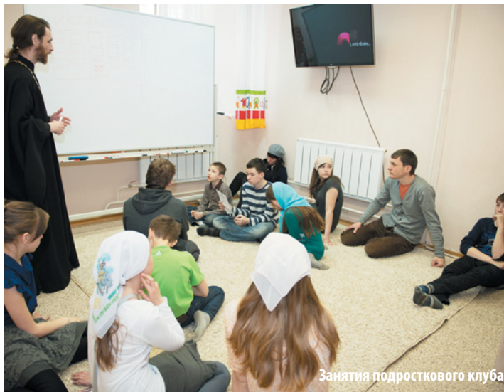
Занятия подросткового клуба

Беседовала Юлия АЛЕКСЕЕВА