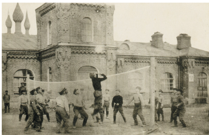
Японские солдаты играют в волейбол у западной стены полковой церкви

62). В 2008 году предприятие признали банкротом. Сегодня в этих полуразрушенных производственных цехах и боксах хозяйствуют коммерческие компании.