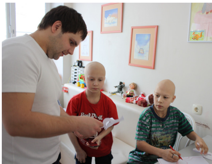
«Милосердие» в отделении детской онкологии