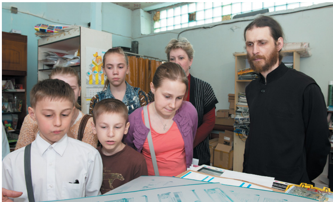
На экскурсии в типографии

– В храме существуют такие направления приходского служения: социальная помощь «Милосердие», медицинская – «Лекарь», юридическая – «Закон», молитвенная – «Молитва», группа приходского консультирования «Просветитель»,