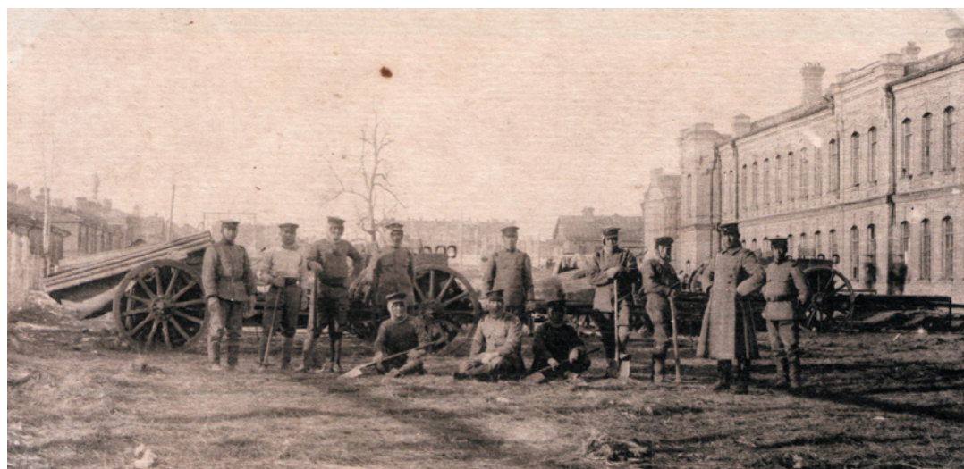
Тяжелая артиллерия японцев в Хабаровске, 1918 год

ХАБАРОВСКИЕ ПОЛКОВЫЕ ЦЕРКВИ СЛЫШАЛИ МОЛИТВУ РУССКИХ СОЛДАТ И ОФИЦЕРОВ, КОТОРЫЕ СТО ЛЕТ НАЗАД ОТПРАВИЛИСЬ В ПЕКЛО ВЕЛИКОЙ ВОЙНЫ